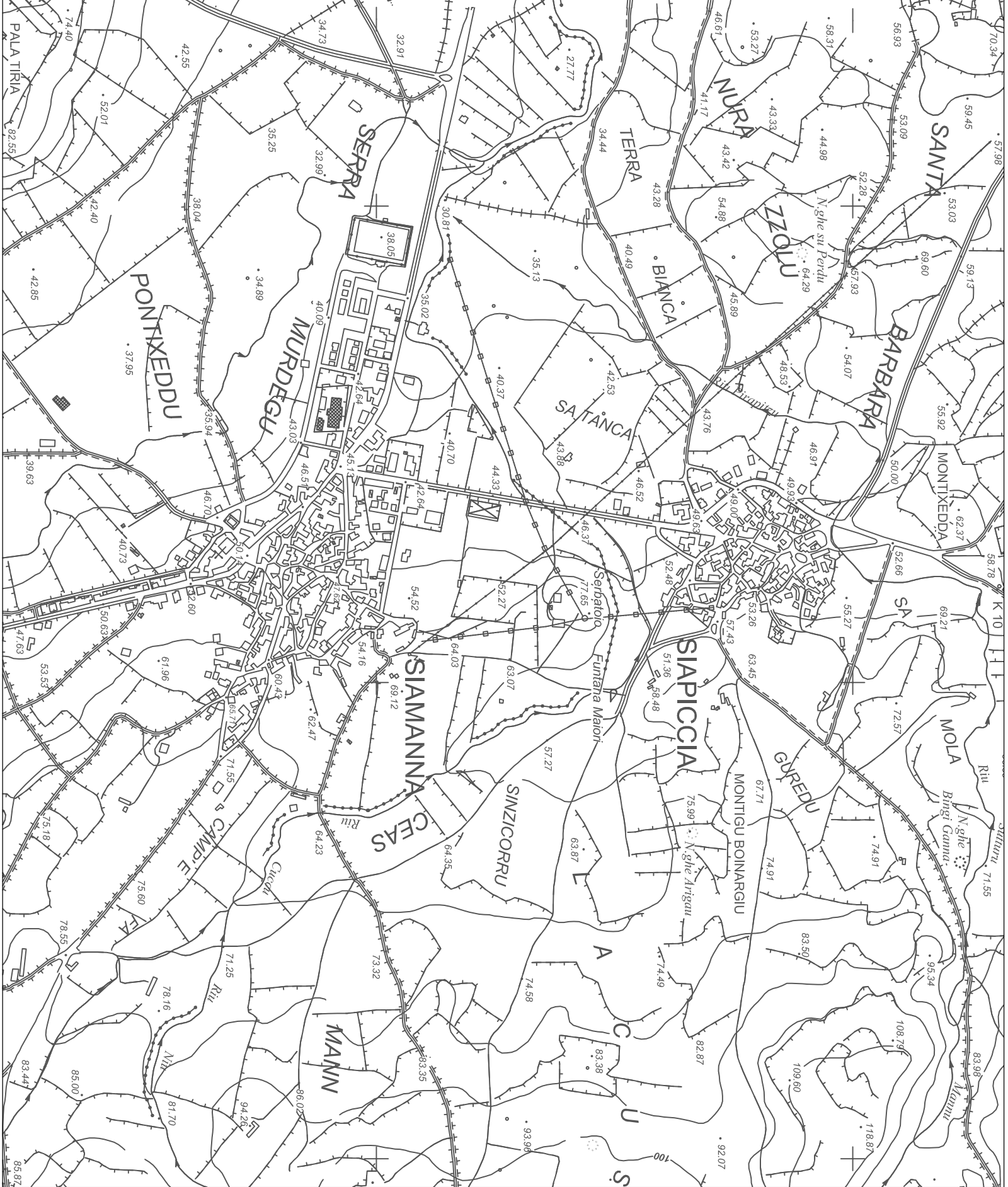
INQUADRAMENTO TERRITORIALE Scala 1:10000

Progettazione e Supporto Tecnico S.T.P. >>> STUDIO TECNICO PROFESSIONALE >>> Dot. Ing. ANDREA LOSTIA INGEGNERIA ARCHITETTURA, URBANISTICA, AMBIENTE E TERRITORIO Viale Marconi 87, 09131 Cagliari - Tel/Fax: 070/8371391 - Cell: 3471458312 - E-mail: studiostp@tiscali.it